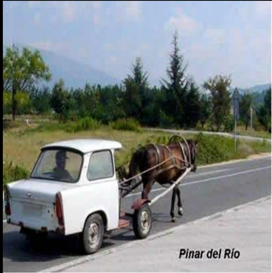
Pinar del Río